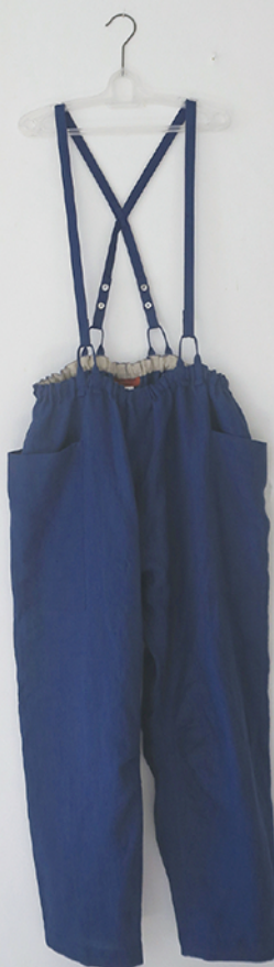
2018 アトリエマニスの夏服 ATELIER MANIS