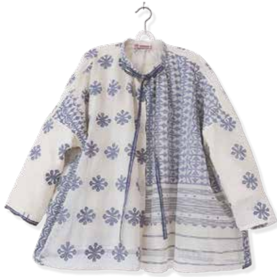
Chemise String Special quality Jamdani from Central Bangladesh with Linen Gauze Lining