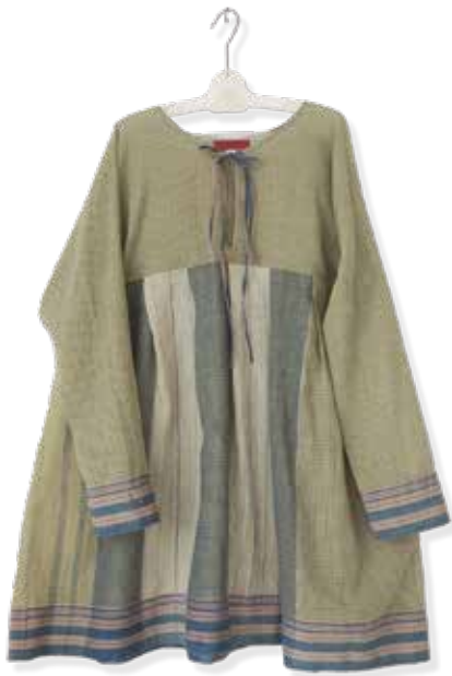
Thai tunic Natural dyeing saree with Jacquard Trim