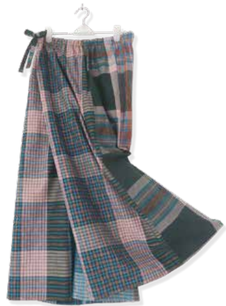
BIG pant "Lunqi" Combination mens daily sarung in Bengal