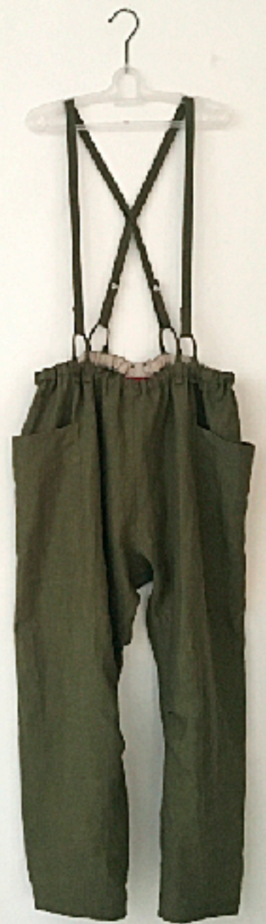
右: AM180105DL No.1 M 国産ライトリネン高密度のベンガルパンツ