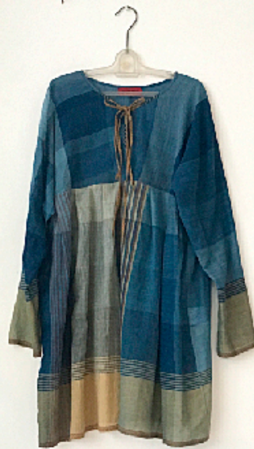
左: AC180302JIN No.5 M バングラデシュ産カーディコットン インディゴ染めサリーのタイチュニック