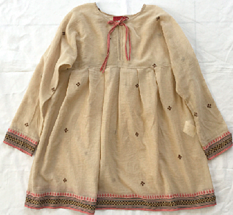
AC180301 No.2 M バングラデシュ産カーディコットン草木染サリーのタイチュニック